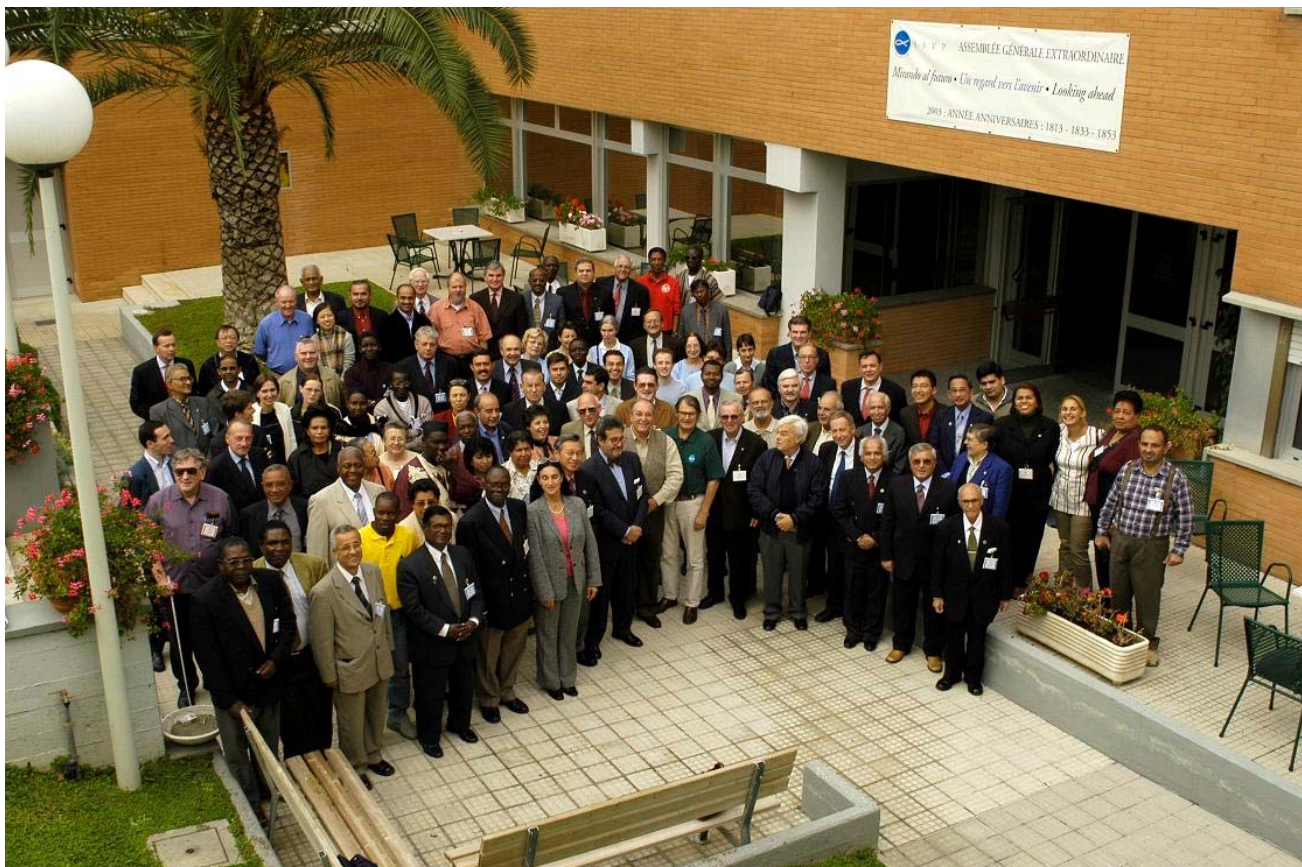
Todos os participantes da Assembleia Geral de Roma,, 2003

Assim, a Assembleia Geral Extraordinária de 2010 terá lugar de 28 de Maio a 1 de Junho de 2010, no Centro de Espiritualidade dos Padres Paulistas, em Salamanca, Espanha, com a presença de representantes de cada um dos países em que a Sociedade está presente, de muitos membros do Conselho Geral e convidados. A Assembleia, sob o tema “Da Esperança, ao Serviço” proporrá conferências sobre a mudança sistémica em e para os pobres, a formação da SSVV e a juventude e recrutamento na Sociedade. O novo Presidente Geral tomará posse no dia 9 de Setembro de 2010, dia da festa de São Vicente de Paulo.