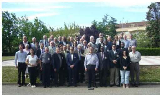
Todos os participantes nas reuniões de Junho de 2009