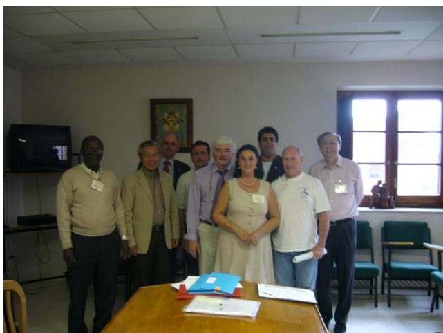
Os 7 Vice-Presidentes Territoriais, o Vice-Presidente Estrutura e M. Thio

Os actuais membros do Comité Financeiro que gere a Concordata estão prorrogados pelo CEI que aprova, por maioria, o orçamento 2009 e 2010.