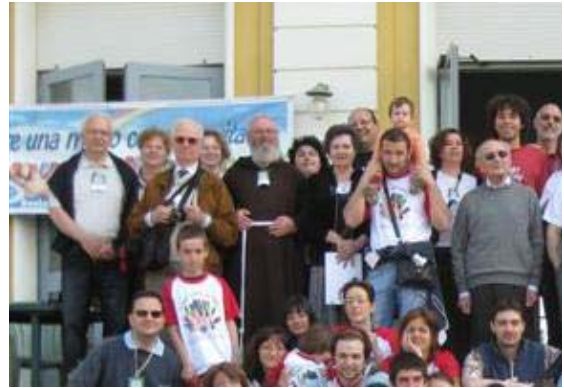
Algunos participantes al encuentro de Marina di Massa