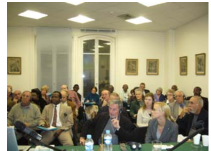
El CEI reunido en Paris

Su misión es coordinar la estrategia internacional de la Sociedad entre las reuniones de la Asamblea General (cada 6 años), procurando respetar sus exigencias, y aconsejar al Presidente General en su gestión de las Conferencias y Consejos del mundo. Se compone de los Presidentes de los Consejos Superiores o Asimilados de los países que cuentan con más de 1000 Conferencias (Inglaterra-Gales, Australia, Brasil, Estados Unidos, India, Irlanda, Italia, Zambia) y de 5 países adicionales, nombrados para dos años (Bélgica, Canadá, Colombia, Escocia RD Congo). Los Vicepresidentes Territoriales, los presidentes de las Comisiones Internacionales, los Consocios encargados de misiones especiales por el Presidente General y el Asesor Espiritual están invitados sin derecho a voto.