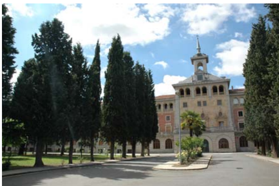
El « Centro de Espiritualidad » de los Padres Paúles Salamanca

Del 8 al 12 de junio de 2009, tendrá lugar en el Centro de Espiritualidad de los Padres Paúles de Salamanca, España, la reunión anual prevista por la Regla de los dos Principales órganos legales de la Confederación Internacional de la Sociedad de San Vicente de Paúl, el Comité Ejecutivo Internacional (CEI) y la Sección Permanente. También es una ocasión de reunir otras instituciones muy importantes para el futuro de la Sociedad: los países del ‘Concordato’ y la naciente ‘Fundación Bailly-Lallier’. También habrá reunión de la Comisión Técnica Territorial y una reunión plenaria de la Mesa Internacional. Recordatorio sobre cada uno de esos órganos del CGI.