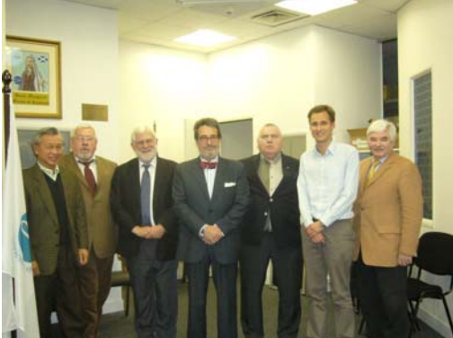
Unos miembros de la Mesa, Parsí, feb. 09

Presidida por el Presidente General, la Mesa se reúne al menos 3 veces al año, en particular para abrir y cerrar cada reunión del CEI. Está encargada de aconsejarlo frente a cualquier problema, y a colaborar con el al desarrollo de la estrategia necesaria a la implementación de las decisiones de las Asambleas del Consejo General y de las recomendaciones del CEI, a la concepción de las estrategias para proponerles.